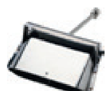
6059.0005 FLAME Powerjet 168mm