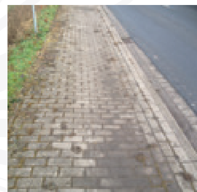
Bewerkt, na 48 uur