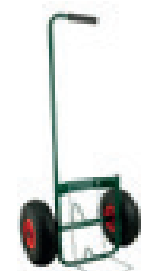
6059.0010 FLAME Powerjet Trolley