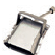
6059.0006 FLAME Powerjet 100mm