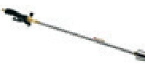
6058.1950 FLAME Super handbrander