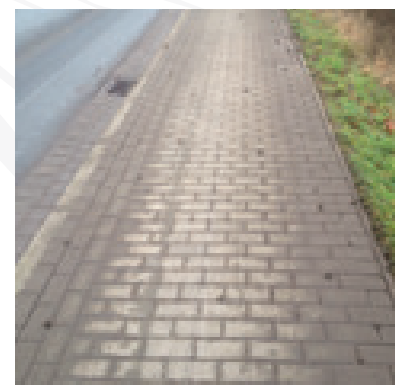
Na 2 weken, schoongeveegd