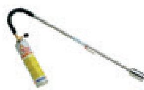
6057.1880 FLAME Jetbrander