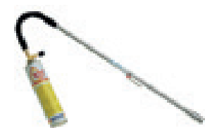
6057.1850 FLAME Puntbrander

Kleine handunits voor selectief bijwerken van ongewenste vegetatie. Eenvoudig te bedienen, goedkoop in aanschaf en uitermate effectief.