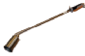
6060.0001 FLAME HB Powerbrander 60mm